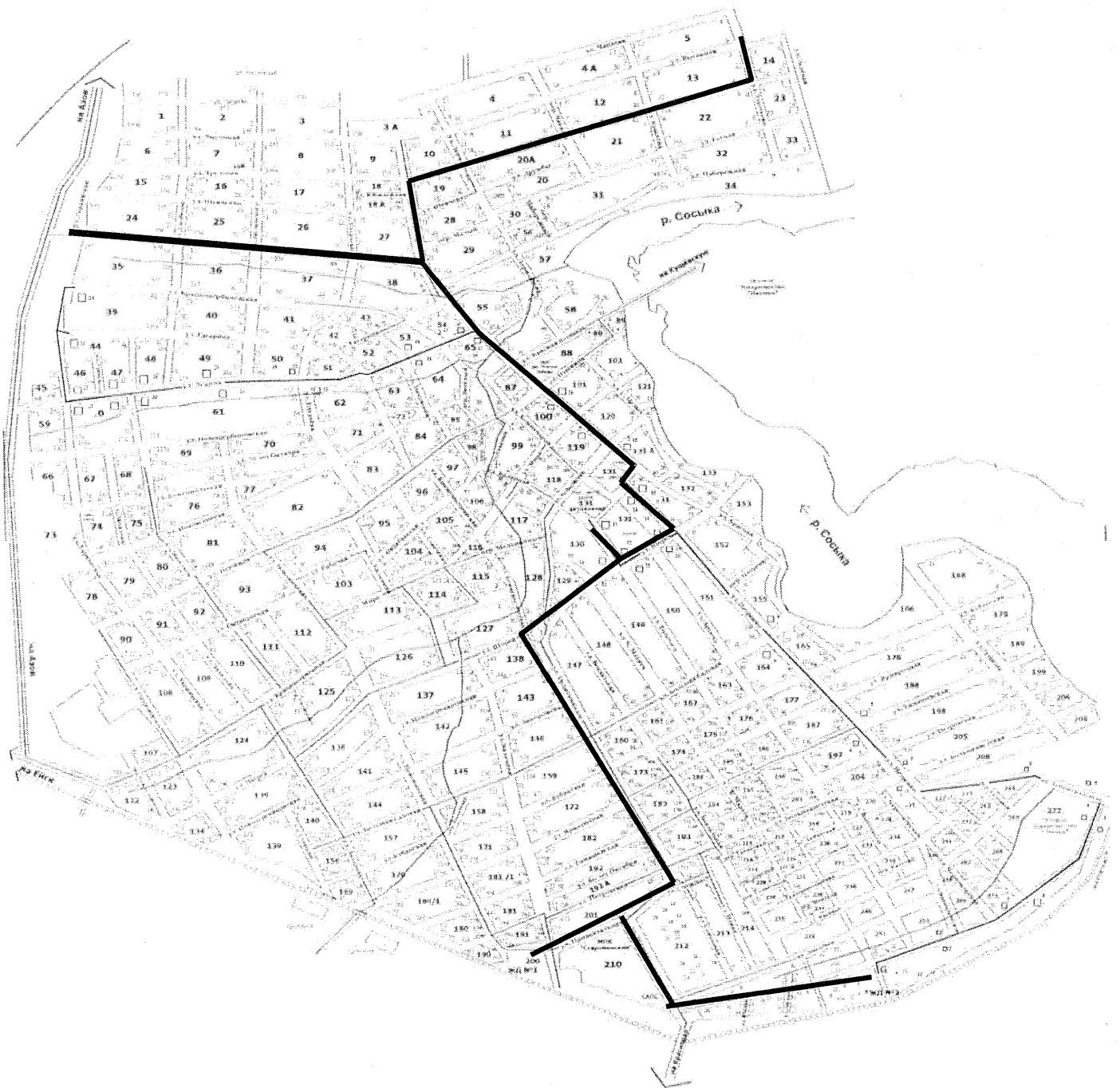
Схема движения по маршруту №2 ЖД №2 Тургенева- ЖД №2

Условные обозначения: — Схема маршрута движения;